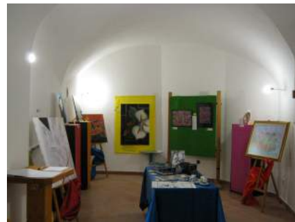
^ Precedente edizione (2015) nelle due sale del Borgo castello ^

<<<< Altra foto del 2015 all'interno del Borgo castello